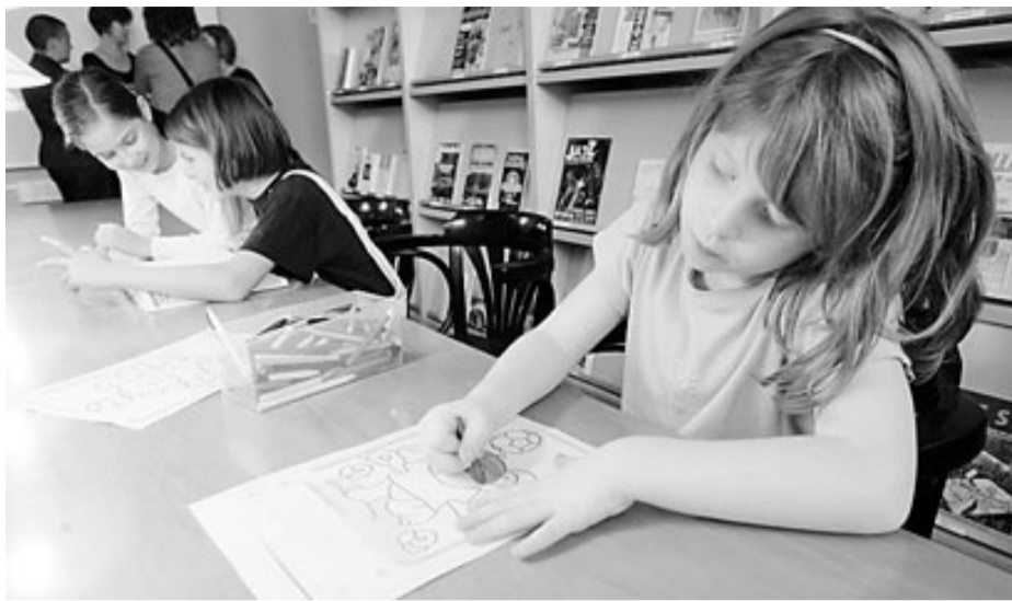
Tres nenes, ahir a la nova biblioteca infantil que ha posat en marxa l'entitat.